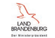
Der Ministerpräsident des Landes Brandenburg