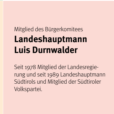
Mitglied des Bürgerkomitees Landeshauptmann Luis Durnwalder

Ministerin der Provinz Friesland für den Bereich Finanzen, Kultur und Tourismus und seit 2012 Vorsitzende des Netzwerkes NPLD (Network for Promotion of Linguistic Diversity).